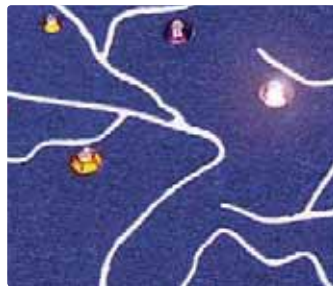
24 Farbpr. u. Edelsteinb.

Blindprägung auf Contour-Tuch-Anthrazit mit Swarovskisteinbesatz (verschiedene Farben u. Größen möglich)