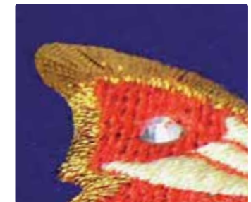
34 Stickerei u. Edelsteinb.

Farbprägung auf Contour-Tuch-Blau mit Edelsteinbesatz (verschiedene Farben u. Größen möglich)