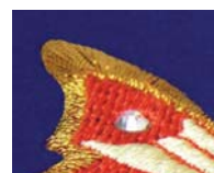
ROYAL PAD Detail