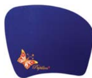
ROYAL PAD Sonderformen

Bitte fordern Sie zu Ihrem Motiv ein individuelles Angebot an.