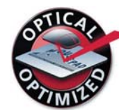
Optimiert für optische Mäuse