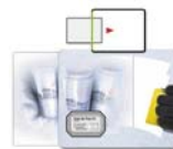
SIDE IN HF Musterpad (Standardbasis weiss)