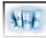
Einleger möglich Größe: 235 x 182 mm