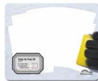
SIDE IN PAD 240 x 195 mm