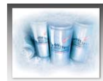
Einleger möglich Größe: 235 x 182 mm