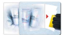
Pad mit Inlay Beispiel