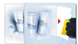
Pad mit Inlay Beispiel