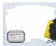
SIDE IN PAD 240 x 195 mm